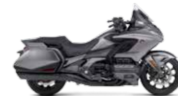
MATT MAJESTIC SILVER METALLIC