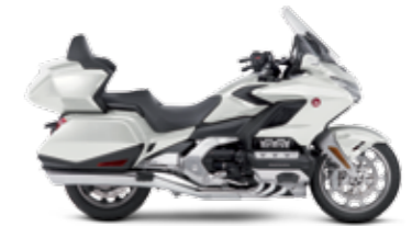
PEARL GLARE WHITE