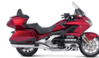
CANDY ARDENT RED