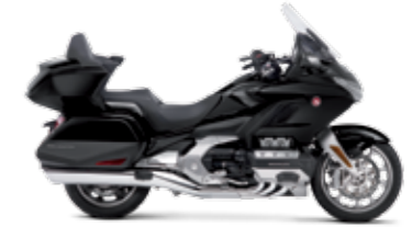
DARKNESS BLACK METALLIC