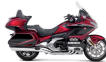
CANDY ARDENT RED/BLACK