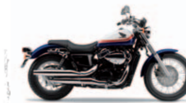
Pearl Heron Blue / White