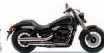
Mat Gunpowder Black Metallic