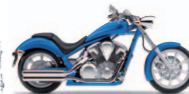
Glint Wave Blue Metallic