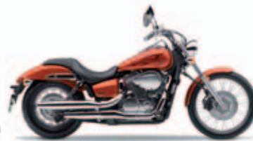
Candy Blaze Orange