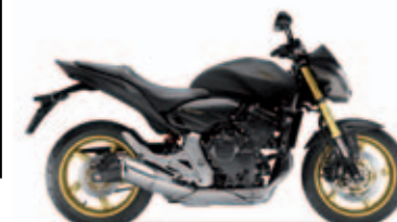
Mat Cynos Grey Metallic

Motorbauart: Flüssigkeitsgekühlter Vierzylinder-Viertakt-Reihenmotor // Hubraum: 599 cm 3 // Max. Leistung: 75 kW (102 PS) / 12.000 min -1 (95/1/EC), umrüstbar auf 25 kW // Max. Drehmoment: 64 Nm / 10.500 min -1 (95/1/EC) // Gemischaufbereitung: PGM-FI-Einspritzung // Bremsen: Combined ABS // Sitzhöhe: 800 mm // Tankinhalt: 19 Liter // Gewicht vollgetankt: 207 kg