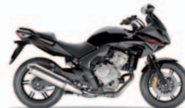
Pearl Nightstar Black