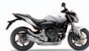
Pearl Cool White