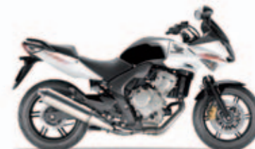
Pearl Cool White

Motorbauart: Flüssigkeitsgekühlter Vierzylinder-Viertakt-Reihenmotor // Hubraum: 599 cm 3 // Max. Leistung: 57 kW (78 PS) / 10.500 min -1 (95/1/EC) , umrüstbar auf 25 kW // Max. Drehmoment: 59 Nm / 8.250 min -1 (95/1/EC) // Gemischaufbereitung: PGM-FI-Einspritzung // Bremsen: Combined ABS // Sitzhöhe: 785 mm (± 15 mm) // Tankinhalt: 20 Liter // Gewicht vollgetankt: 222 kg