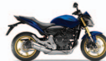
Pearl Pacific Blue