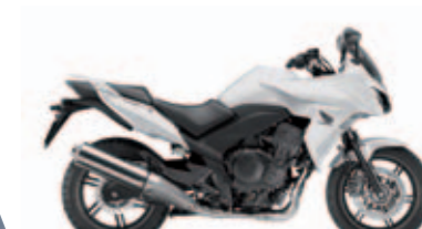
Pearl Cool White