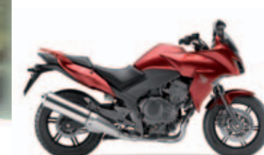
Pearl Siena Red

Motorbauart: Flüssigkeitsgekühlter Vierzylinder-Viertakt-Reihenmotor // Hubraum: 998 cm 3 // Max. Leistung: 79 kW (107 PS) / 9.000 min -1 (95/1/EC) // Max. Drehmoment: 96 Nm / 6.500 min -1 (95/1/EC) // Gemischaufbereitung: PGM-FI-Einspritzung // Bremsen: Combined ABS // Sitzhöhe: 795 mm (± 15 mm) // Tankinhalt: 20 Liter // Gewicht vollgetankt: 245 kg