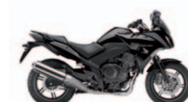
Pearl Nightstar Black