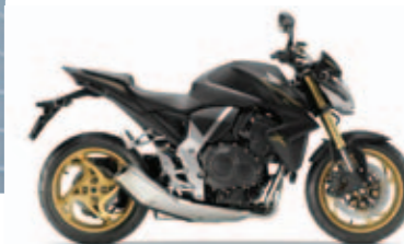
Mat Cynos Grey Metallic

Motorbauart: Flüssigkeitsgekühlter Vierzylinder-Viertakt-Reihenmotor // Hubraum: 998 cm 3 // Max. Leistung: 92 kW (125 PS) / 10.000 min -1 (95/1/EC) // Max. Drehmoment: 99 Nm / 7.750 min -1 (95/1/EC) // Gemischaubereitung: PGM-FI-Einspritzung // Bremsen: optional Combined ABS // Sitzhöhe: 828 mm // Tankinhalt: 17 Liter // Gewicht vollgetankt: 217 kg / 222 kg mit C-ABS