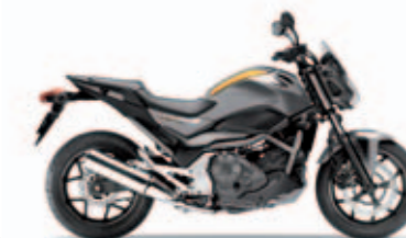
Seal Silver Metallic