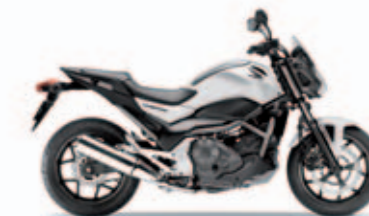
Pearl Sunbeam White