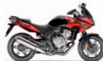
Pearl Siena Red