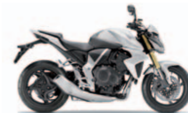
Pearl Cool White