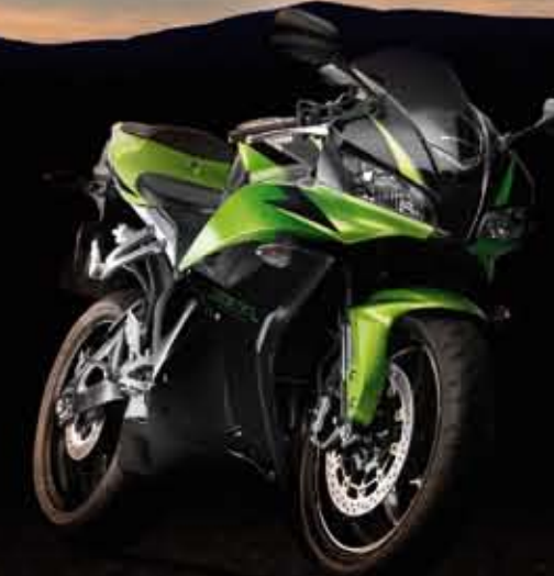
BRIGHT LIME GREEN METALLIC