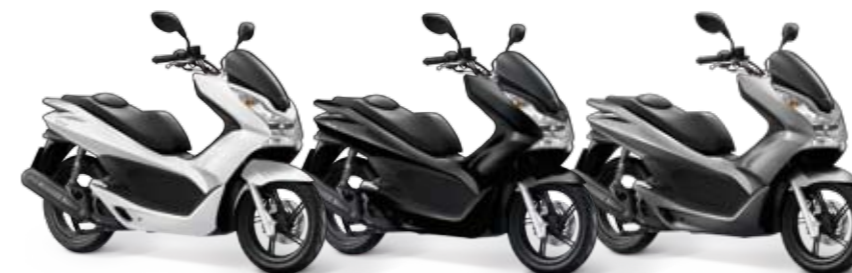
Pearl Himalaya White