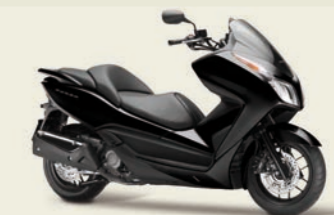
Asteroid Black Metallic