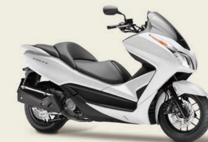
Pearl Himalayas White