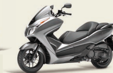
Seal Silver Metallic