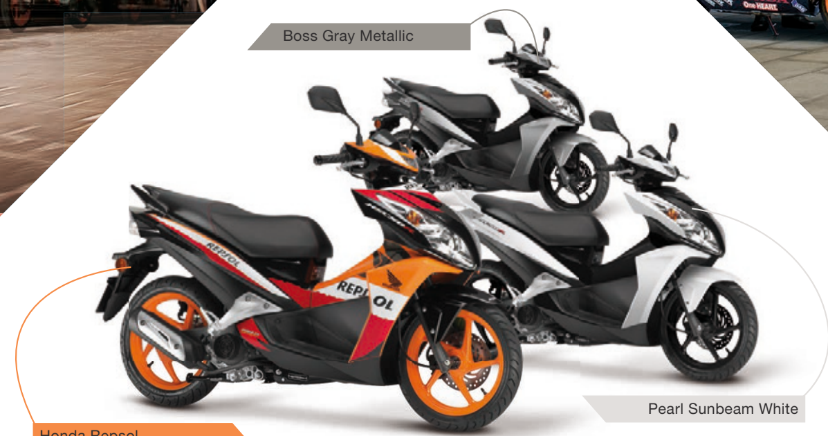
Pearl Sunbeam White

Gefällt nicht nur Dir Die 14 Zoll-Felgen ziehen nicht nur Blicke auf sich, sie optimieren auch Performance und Handling. So hat jeder seine Freude.