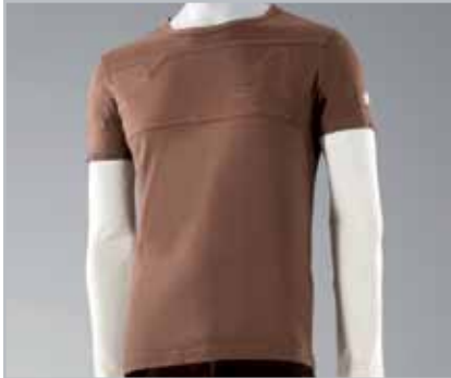
V4 Long Sleeced Shirt

S = 08MLW-V40-TSS M = 08MLW-V40-TSM L = 08MLW-V40-TSL XL = 08MLW-V40-TSXL XXL = 08MLW-V40-TSXXL