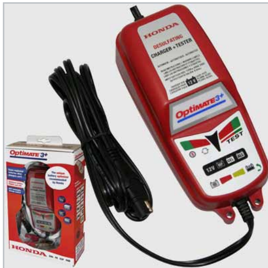
Honda Optimate 3+

Wasserdichtes Gehäuse. Elektronische Schaltung, reduziert den Stromverbrauch bei Erhaltungsladung auf unter einen Euro pro Jahr, Ladezyklus schont die Batteriezelle und verlängert daher die Lebensdauer der Batterie. Automatischer Batterietest vor jedem Ladeerhaltungszyklus. Dieser Test steuert den Ladestrom alle 30 Minuten neu und reduziert somit die laufenden Kosten.